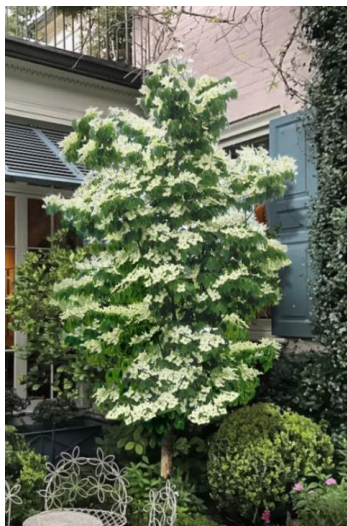
Japanse Kornoelje ( Cornus kousa 'Green Dwarf')