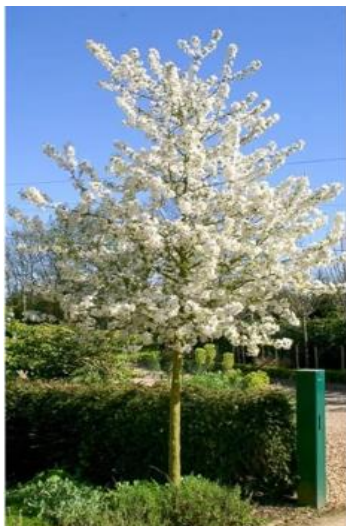
Sierappel ( Malus Evereste )

Een boom kan erg mooi zijn, maar ook voor veel onderhoud zorgen. Bomen die betaalbaar zijn, niet te groot worden en daardoor makkelijk te onderhouden zijn, zijn bijvoorbeeld: