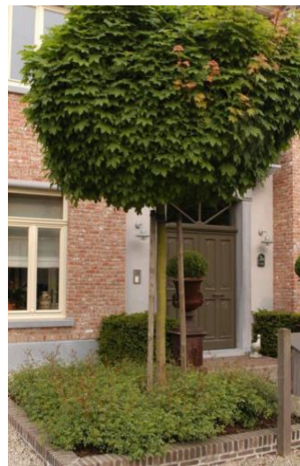
Bolusdoorn ( Acer campestre 'Nanum')